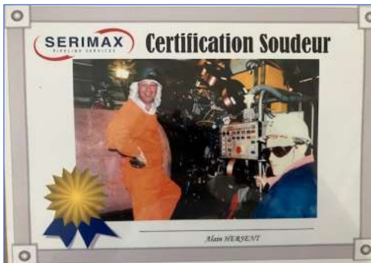
Photomontage pris et bricolé par de facétieux techniciens

Et, pour terminer et reprendre ce que disait Pierre Laborie à ETPM, un peu de chance... A ce sujet, j'ai piloté Serimer tel le pilote qui ignore le fonctionnement de ses réacteurs, ma chance fut de trouver une équipe motivée et compétente. Merci aux ingénieurs, aux techniciens, aux soudeurs et, plus généralement à tout le personnel de Serimer/Serimax... J'en passe !