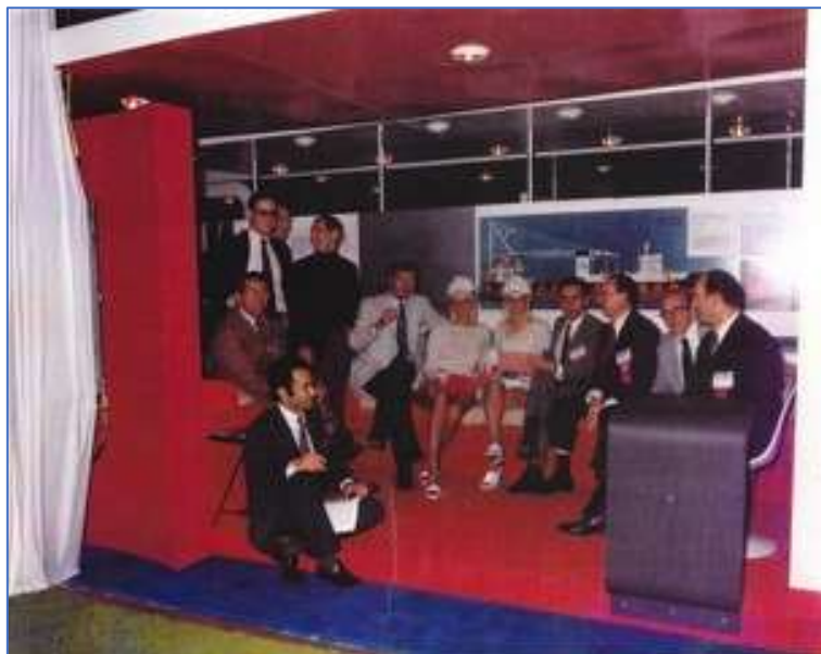
Lors de l'OTC en 1981

Serimer signifiait à l'origine "Société d'exploitation des richesses de la mer » et Raymond Aubert pensait déjà, en précurseur, à ajouter une branche parallèle à DASA pour l'extraction des nodules polymétalliques.