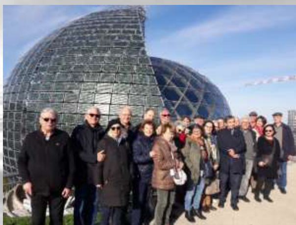
Michel Fouteau La Seine Musicale