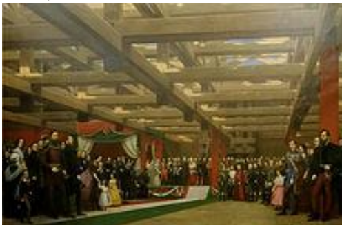
<- La pose de la première pierre du Pont à chaînes en 1842 symbolise l'unification des deux rives du Danube

Au cours des XVII e et XVIII e siècles, malgré une inondation dévastatrice en 1838 qui fit 70 000 morts, Pest connaît le plus fort taux de croissance grâce à un commerce très actif, contribuant très majoritairement à la croissance combinée des trois villes. En 1900, sa population dépasse celles de Buda et Óbuda réunies. Au cours du siècle suivant, la population de Pest sera multipliée par vingt, alors que celles de Buda et d'Óbuda seront quintuplées. En 1780, l'allemand est introduit comme langue officielle par les Habsbourg.